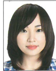
頭髮遮蔽到 眼睛或耳朵