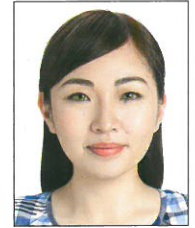
使用有色 隱形眼鏡