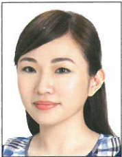
頭部側向一邊、 未正視鏡頭