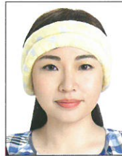
臉部及雙耳 被物品遮蔽